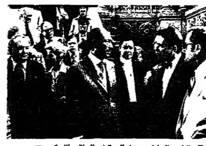
الرئيس السادات يتحدث الى الوفد البرلاني المصري